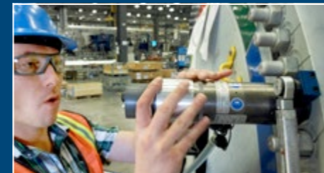
Schraubenspannvorrichtung mit BodAS Bolt tensioning devices BodAS included