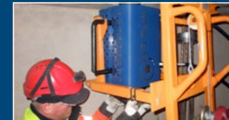
Bündelspannpresse Multi-strand stressing jacks