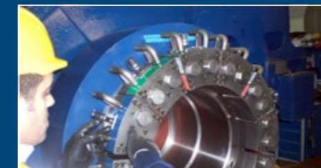
Schrumpfscheibenmontage Shrink disc assembly