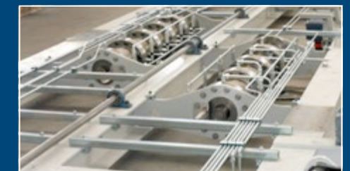
Hydraulikmontage vor Ort Hydraulic assembly on site