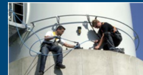
Ankerbolzenprüfung Anchor bolt tests