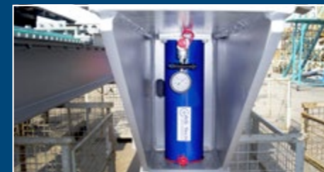
Multi Lifting System Multi lifting systems