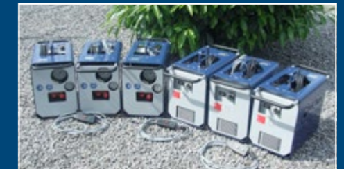
Hydraulikaggregate Hydraulic power units